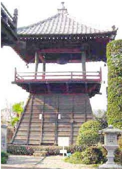
仁叟寺鐘楼堂 (吉井町重要文化財)

れぞれに好（気持ちが良い）悪（不快）平（どちらでもない）の三種があって 3 \times 6 = 18 の煩惱となり、これが、また浄（きれい）染（きたない）の二種に分かれ 18 \times 2 = 36 の煩惱になり、さらに、過去、現在、未来の三つの時間が関わって、 36 \times 3 = 108 となります。これが、百八の煩惱だということです。これを鐘の音が きよ めていくということです。日本では、鐘や鈴の音に浄化作用があるというのは古くから信じられていました。秋の虫の代表である鈴虫を日本人が昔から愛 め でるのも、ここにその理由があるのかも知れませんね。