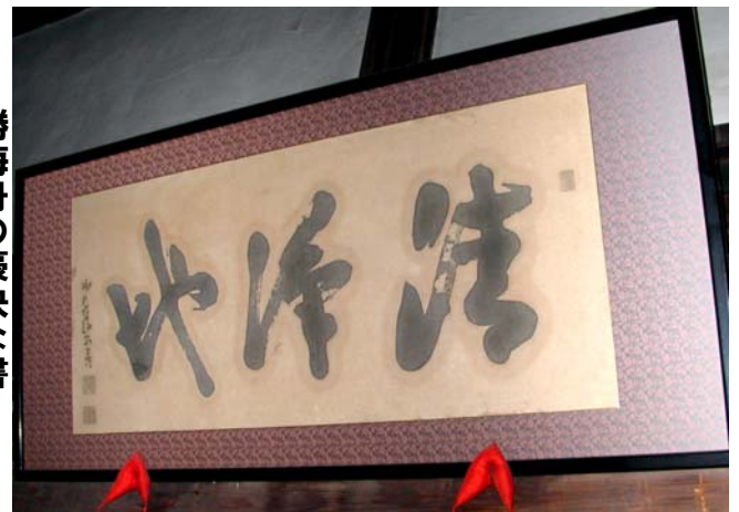
勝海舟の豪快な書

は「清らかなる聖地」といったところでしょうか。筆者の豪快であったといわれている性格通りの雄大な書です。