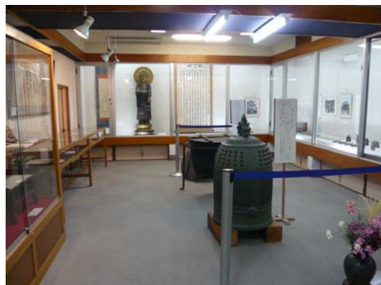
↑ 企画展風景（資料館）