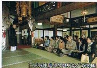
仁叟寺住職より歴史などが説明