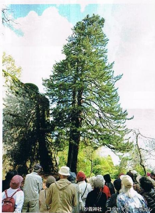
妙義神社 コウヤマキ・シラカシ

県民と共に、山や森林に親しみ、そこに学び、その恵みに感謝し、そこを守る取り組みを推進するために、県や森林・林業関係団体等により推進協議会を設立。毎年10月は「ぐんま山と森の月間」に制定されました。この月間を中心に同協議会等により、多くの県民に自然を身近に感じ、環境を考える契機とすることを目的に、自然の重要性を呼びかけ、自然とふれあうイベントが一斉に開催されています。