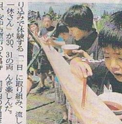
久昌寺境内で流しそうめんを楽しむ児童

り込みで体験する「一日一休さん」が30、31の両日、安中市原市の久昌寺(久保直彦住職)で行われた。50人が掃除や座禅