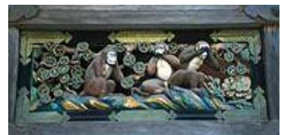
しんぎゅうしゃ さんざる 日光東照宮神厩舎「三猿」

うそ まこと 行(う)聞く(嘘か真をしっかりと聞く)の姿勢を失ってはならないでしょう。国も人も全てに本物が問われる時代であります。