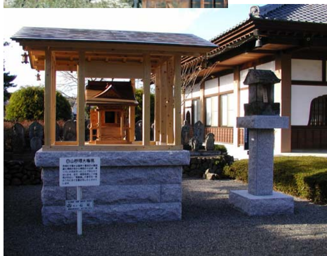
↑左 白山大権現 右 金毘羅大権現

寺域の守護は元より、水を司る龍神信仰と相成って白山様は信仰されておりました。是非、お参りください。